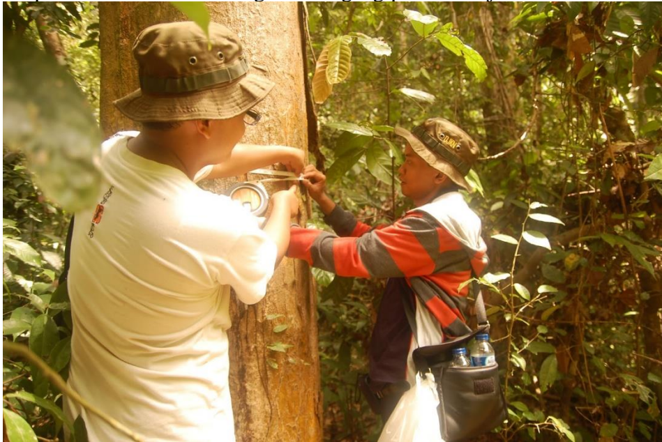
(a) Pengukuran pohon