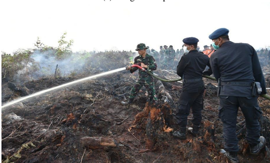
(b) Pemadaman kebakaran hutan